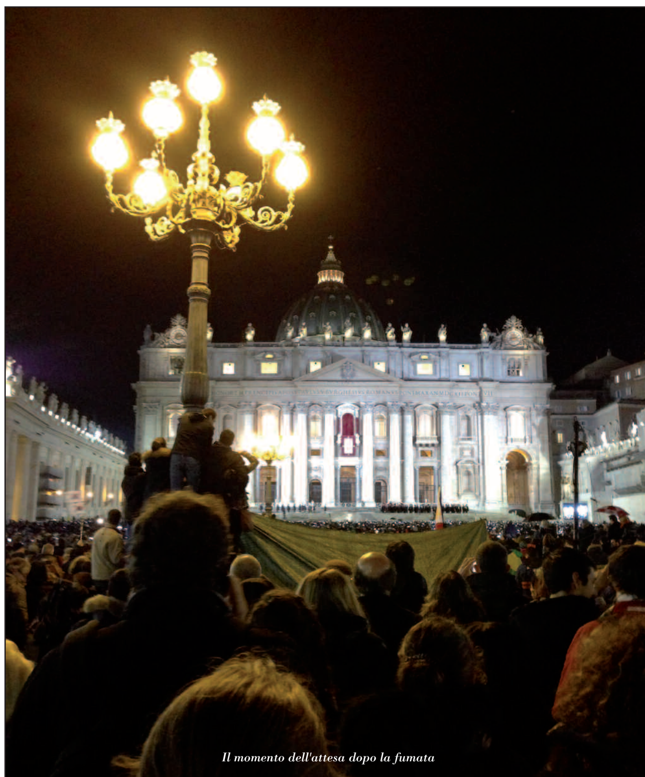
Il momento dell'attesa dopo la fumata

Non so quanto conosca il nostro Paese, ma sicuramente si troverà a casa. La cultura e il temperamento latini ci accomunano, avrà la chiave di let-